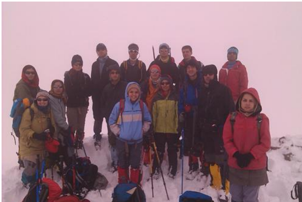
نگاره های برنامه: